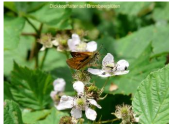
Dickkopffalter auf Brombeerblüten

Samstag / Sonntag, 11. u.12.5.2019: besuchen Sie unseren BUND-Stand auf der Regio-Schau in Bad Segeberg / Landesturnierplatz (Eutiner Straße / Marienstraße) Weitere Infos: https://regioschausegeberg.de/