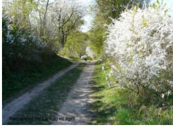
Redder im April

Mitgliedertreffen des BUND-Norderstedt mit einem Lichtbilder-Vortrag über "Die Bedeutung u. Gefährdung der Knicks in Schleswig-Holstein" von Ingrid Niehusen / BUND Norderstedt.